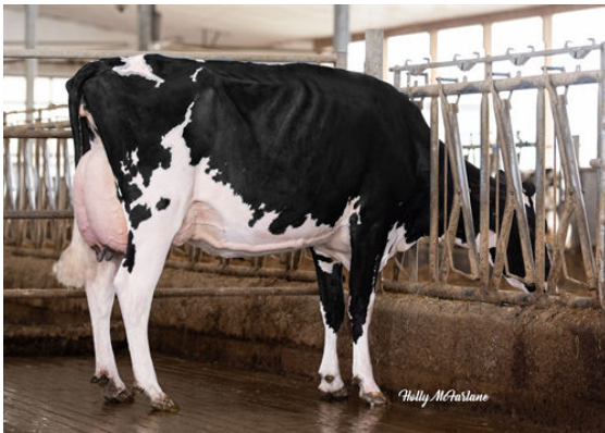
CARLDOT WINDMILL LAYLA