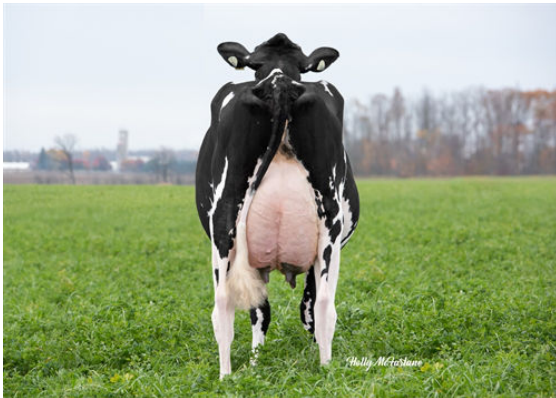
CARLDOT WINDMILL LAYLA